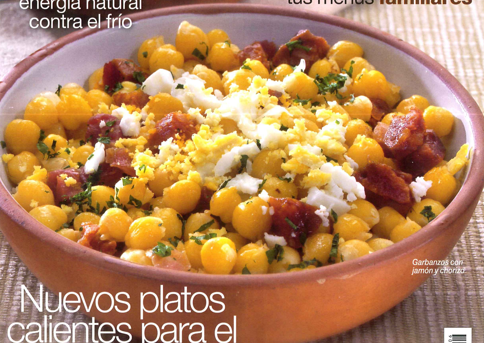
Garbanzos con jamón y chorizo

Ideas para elaborar tus menús familiares